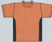
T-Shirt Hals-RV 5577602