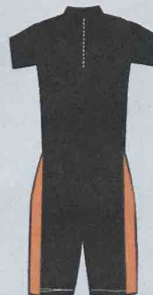
Body mit Arm 338602