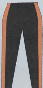
Leggings 330002 330202 Bein-RV