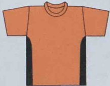
T-Shirt Rundhals 5577702 T-Shirt Paspelhals 5577802