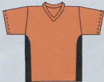
T-Shirt V-Hals 5577302