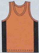
Herren Singlet 559402/H 019402/H